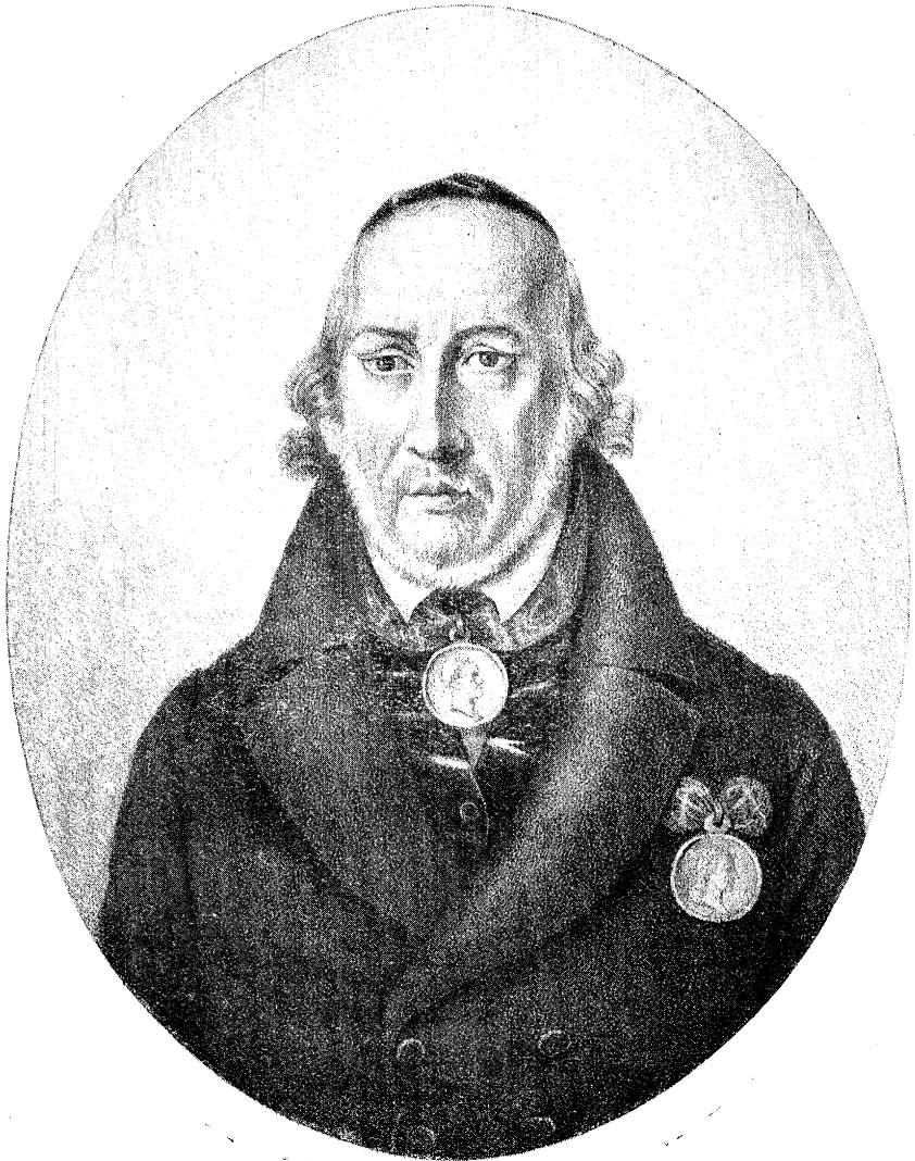
פאָרטרעט פֿון יוסף פּערל דער אַריגינאַל—אין דער פּערל-שול אין טאַרנאָפּאָל (לויט אַ גראַווירע, געדרוקט אין לעמבערג)