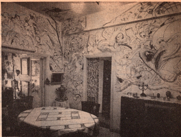
אל ציוריה קוד!?! — זקנה רבקה מתוך דחה סמיני של 'צירות קירות הבית' היקטוריו לרשעה ומרים נתנה מורקו לנתנהויה ציורים וזמרים קטוריוס סטוריוס סטני שלמרת קוניה.

נערה בת 16, אמן בשל ומבוגר, אשר ציוריה הנפלאים, בשחור-לבן, מקשטים נאות קירות בירושלים - ושירה מעוררים התפעלות