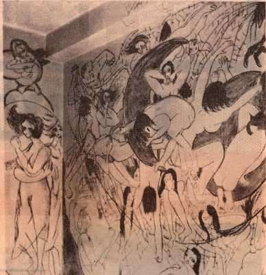
„הקטן שאני מתחילה, איני יודעת מה אני עומדת לעצור“ - אומרת רבקה