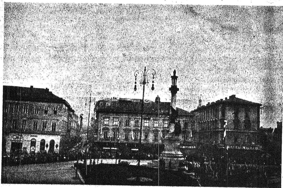
מאריאצקי-פלאץ מיט מיצקעוויטשעס דענקמאל אין דעמבערג

געווען דורך... איר וויסט שוין דורך וועמען. עס האָבן דאָרט געשפילט סקריפענדיקע אַרקעסטערס. זיי האָבן געשפילט אַלטע - דעמאָלט אָבער גאָר נייע און פרישע שטרומס-וואַלצער. עס פלעגן אַהין קומען די עסטרייכישע פעלדפעבלען און קאַפראַלן.